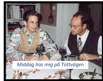
Middag hos mig på Tottvägen